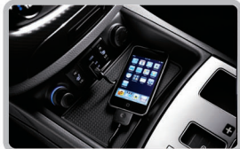
دارای پورتهای USB iPod، AUX