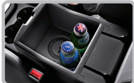
سردکن مواد غذایی