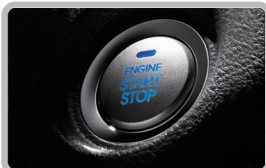
مجهز به استارت دکمه ای