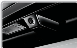
دوربین نقطه کور عقب