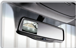
آینه دید عقب الکتروکرومیک با قطب‌نمای دیجیتال