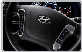
کنترل سیستم صوتی بر روی فرمان