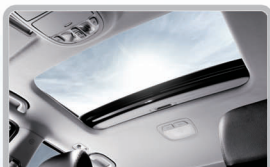
سقف شیشه ای (چندحالتی)