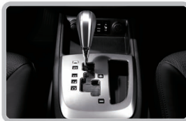
گیربکس اتوماتیک ۶ دنده (شیفترونیک)