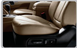
صندلی راننده و سرنشین جلو با تنظیم الکتریکی