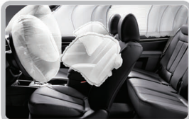
دارای ۱۲ کیسه هوای ایمنی (Airbag)